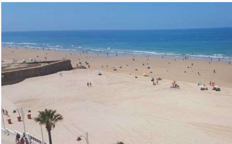
Playa de la Victoria

Segundo espigón de la Playa Santa María del Mar - Muralla Cortadura (parte de playa la Victoria)