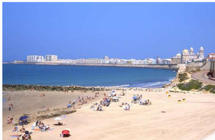
Playa Santa María del Mar